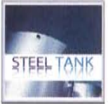
スチールタンク自動作画